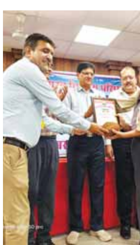
शहडोल। भारत विकास परिषद स्वामी विवेकानंद शाखा शहडोल द्वारा स्थानीय विधि महाविद्यालय में गुरु वंदन-छात्र अभिनंदन कार्यक्रम का आयोजन किया गया।