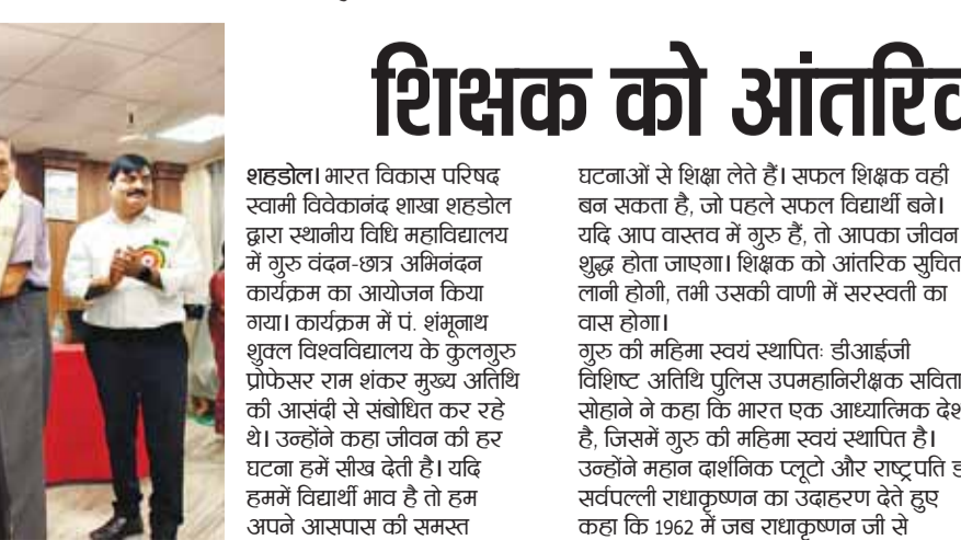
शहडोल। भारत विकास परिषद स्वामी विवेकानंद शाखा शहडोल द्वारा स्थानीय विधि महाविद्यालय में गुरु वंदन-छात्र अभिनंदन कार्यक्रम का आयोजन किया गया।